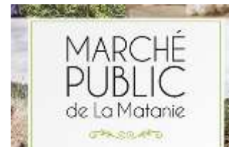
Table de concertation bioalimentaire du BSL

Filière des produits forestiers non ligneux du Bas-Saint-Laurent